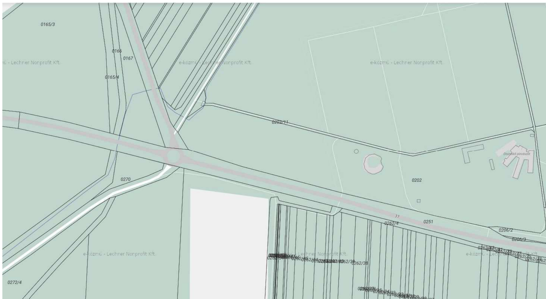
Átnézeti tervezési terület